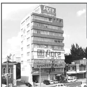
(株)ケイオーパートナーズ ダイオキビル8F